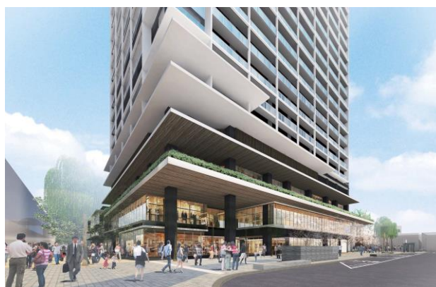
西街区・マンション低層部