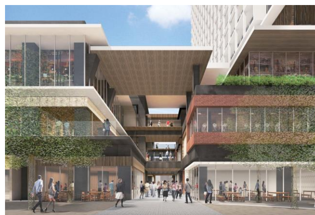
路地空間の再生ゾーン