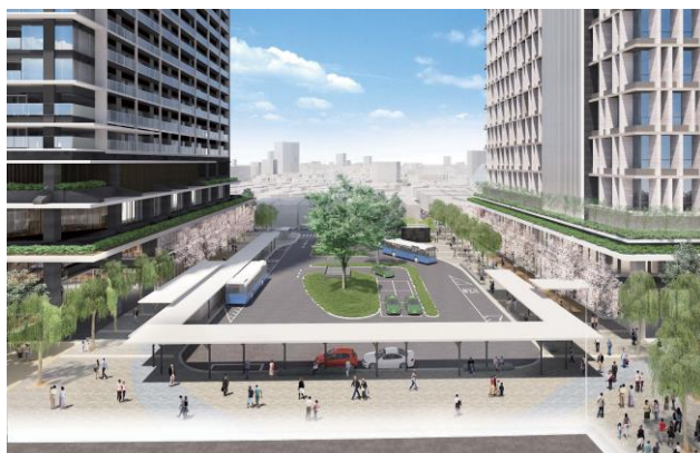
交通広場（駅前広場）