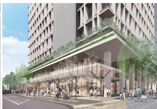
東街区・建物低層部