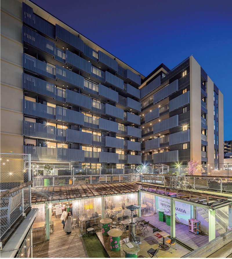
にぎわい施設「クラフトビレッジ西小山」

本事業は、2024年3月に、都内の防災街区整備事業で11番目に工事完了を迎え、現在も公共施設工事の一部を残しているものの、整備された防災施設建築物であるパークホームズ西小山(分譲済み)は、まちの風景の一部として調和してきており、地震や火災だけでなく、本年8月のゲリラ豪雨による水害も免れ、地域の防災性向上にも寄与している。